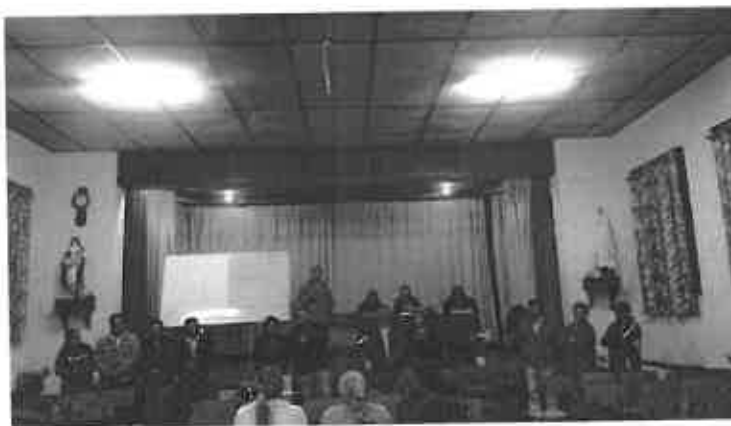
LOS ELECTOS PARA SER AUTORIDADES DE ADMINISTRACION Y VIGILANCIA