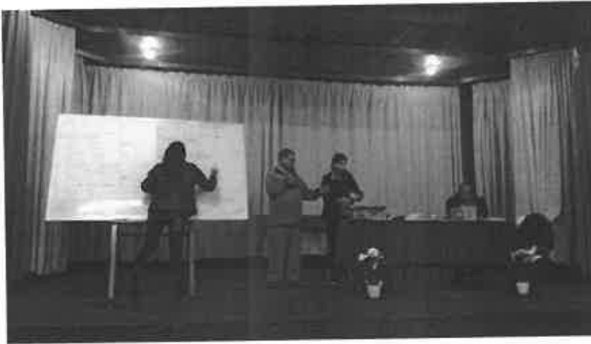
EL COMITÉ ELECTORAL EN PROCESO ELECTORAL