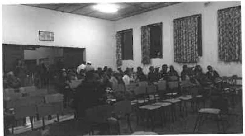
LAS Y LOS ASOCIADOS EN ASAMBLEA GENERAL ORDINARIA DE ELECCION DE CONSEJEROS