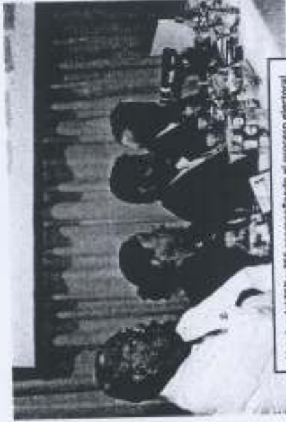
Vocales del TED y TSE acompañando el proceso electoral