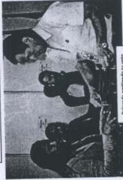
Delegado emitiendo su voto