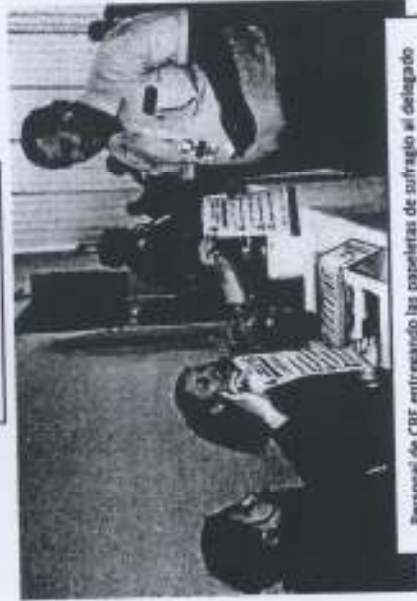
Personal de CRE entregando las papeletas de sufragio al delegado