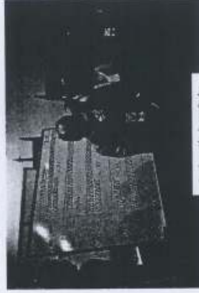
Proclamación de resultados