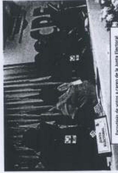
Recuento de votos a cargo de la Junta Electoral