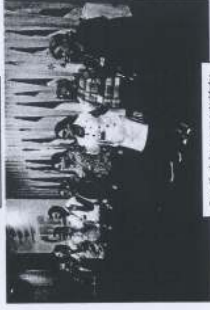
Poseción de las nuevas autoridades